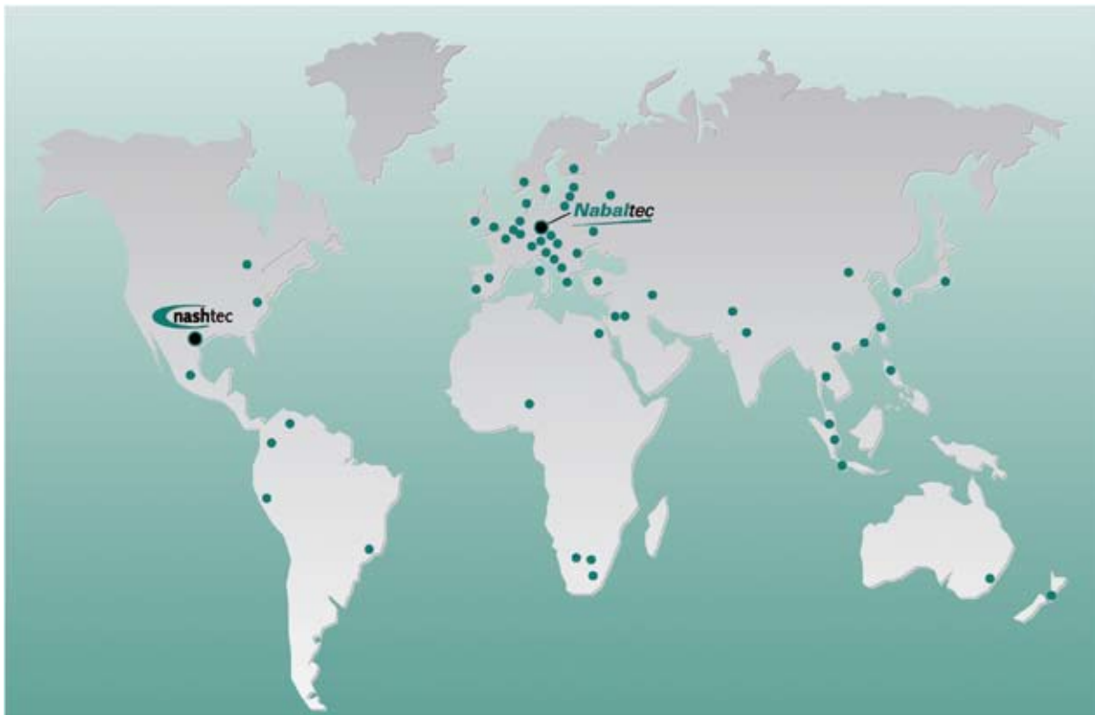
Nabaltec und Vertriebspartner